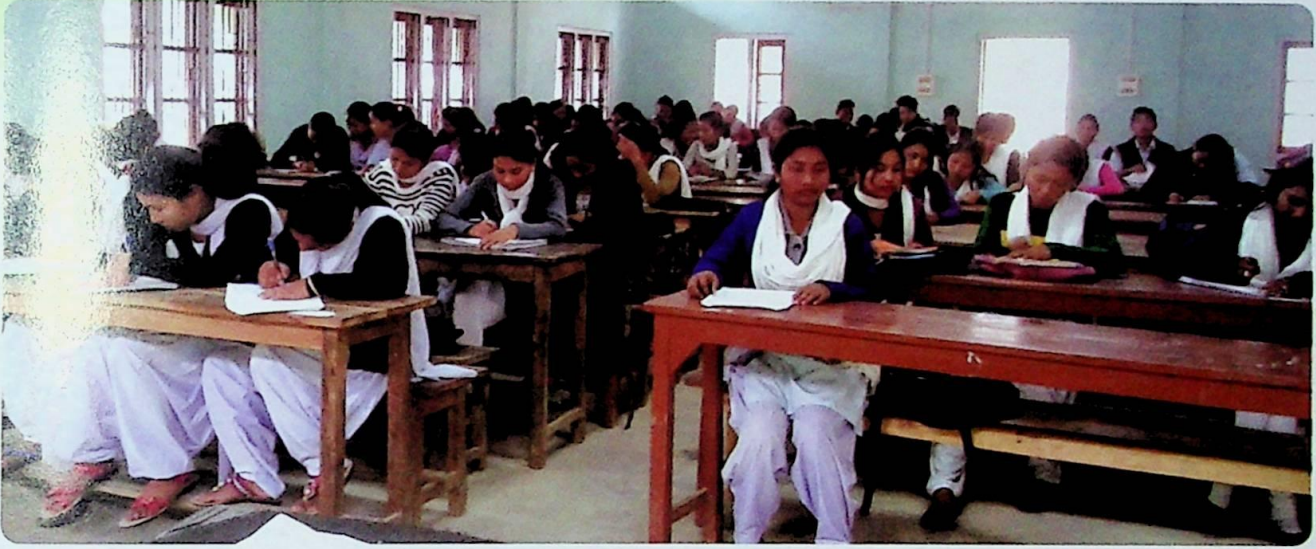
‘মহাবিদ্যালয় সপ্তাহত’ আলোচনী বিভাগৰ দ্বাৰা আয়োজিত ‘থিতাতে লিখা প্ৰবন্ধ, গল্প আৰু কবিতা প্ৰতিযোগিতা’ৰ এটি দৃশ্য