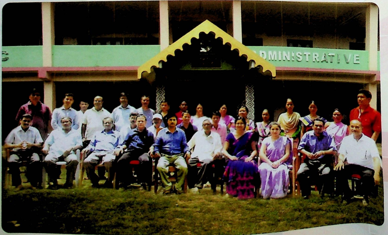
দুধনৈ মহাবিদ্যালয় কাৰ্যালয়ৰ কৰ্মচাৰী আৰু অধ্যক্ষ