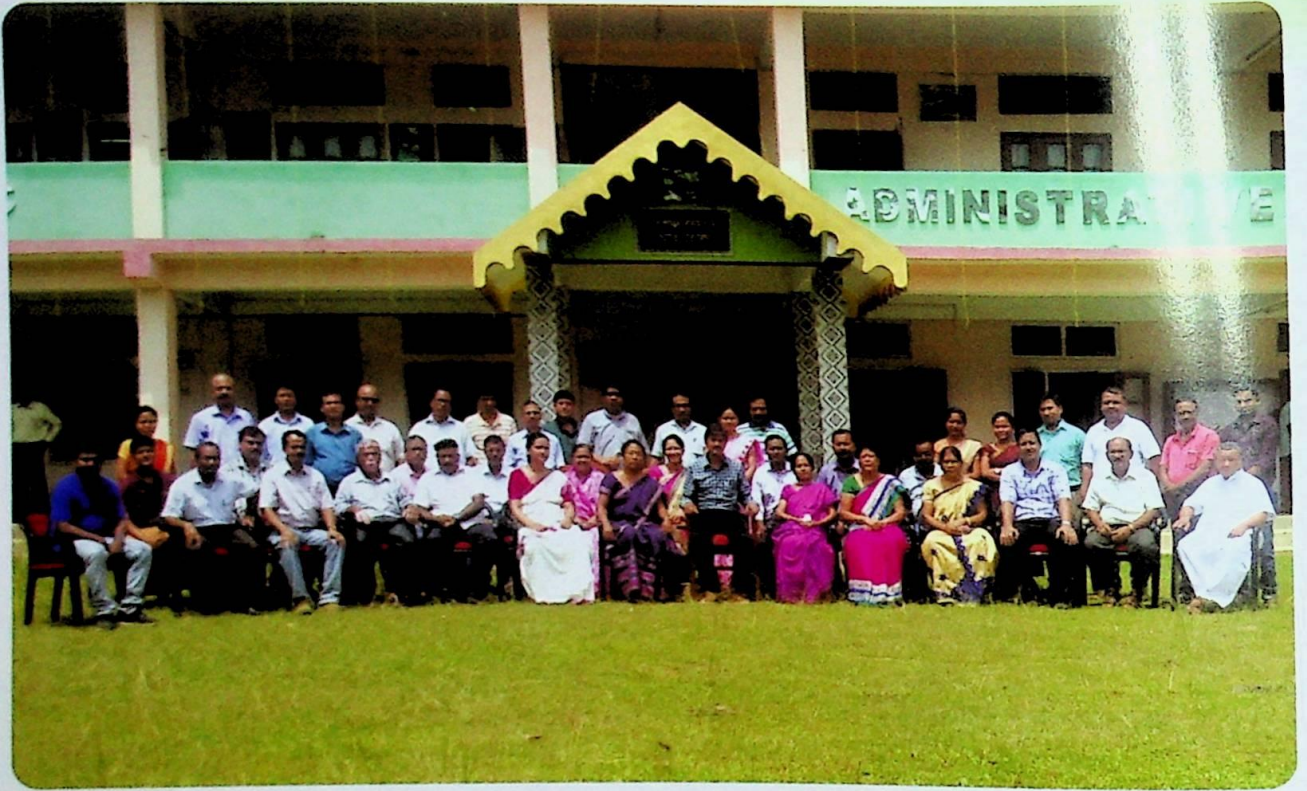
দুধনৈ মহাবিদ্যালয়ৰ শিক্ষক-শিক্ষয়িত্ৰী আৰু অধ্যক্ষ