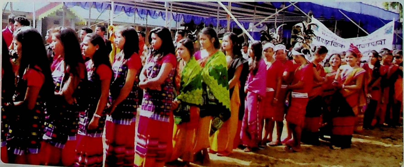
‘মহাবিদ্যালয় সপ্তাহত’ আয়োজন কৰা সাংস্কৃতিক শোভাযাত্ৰাৰ একাংশ