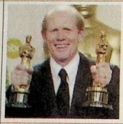
পৰিচালক ৰবা হাৰাৰ্ড