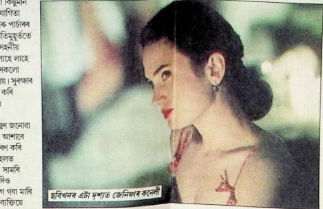
ছবিখনৰ এটা দৃশ্যত জেনিফাৰ ক'নলী

২০০২ চনত প্ৰদান কৰা ৭৪তম অস্কাৰ বঁটাৰ মুঠ চাৰিটাকৈ বঁটা আঁতৰি আনিবলৈ সক্ষম হৈছিল 'এ বিউটিফুল মাইণ্ড'-এ। ইয়াৰ ভিতৰত আছিল শ্ৰেষ্ঠ ছবি আৰু শ্ৰেষ্ঠ পৰিচালকৰ বঁটা। কাহিনী কৰ্মৰ অল্পত ক্ষমতা প্ৰদৰ্শন কৰিছিল পৰিচালক ৰবা হাৰাৰ্ডে। তেওঁৰ প্ৰতিভাৰ স্বাক্ষৰ দেখা গৈছিল প্ৰতিটো ফ্ৰেমত। জেনিফাৰ চৰিত্ৰত বাহেল ক্ৰ' অভিনয় আছিল অমৰা। ইয়াৰ এটা যত্ন আগতে কৰা হৈছিল মেডিয়াৰ দৰে ছবিৰ অভিনয় কৰা বাহেল ক্ৰ'ই সম্পূৰ্ণ বিপৰীতমুখী চৰিত্ৰ এটাত কৰা মৰ্মস্পৰ্শী অভিনয়েৰে সকলোৰে হৃদয় চুই গৈছিল। বিশ্ব চলচ্চিত্ৰ ইতিহাসত 'এ বিউটিফুল মাইণ্ড' এখন 'মাষ্টৰপীচ' হিচাপে চিৰসন্মত হৈ ৰ'ব।