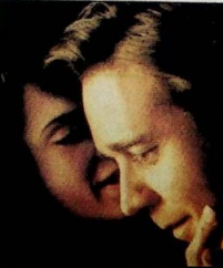
ছবিখনক জয় এটা পুৰস্কাৰ